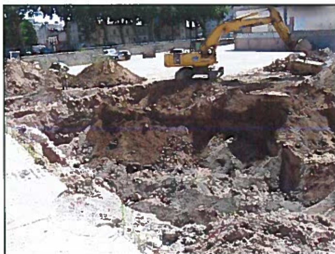
Figure 1 : Phase d'excavation des terres souillées

Ils se sont basés sur les recommandations de notre diagnostic et ont été adaptés in situ selon les relevés au PID afin d'éliminer les zones de contamination.