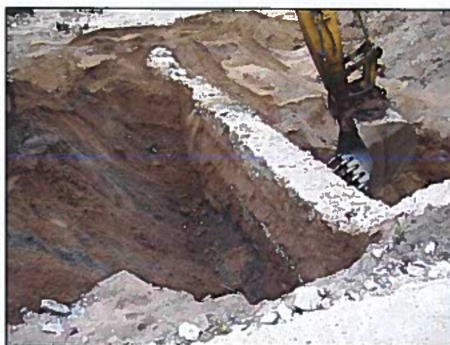
Figure 3 : Découverte de murs de fondation enterrés

Au total, ces matériaux représentent 213 tonnes de déblais, actuellement stockés au centre de GTTP de Vouvray (37).